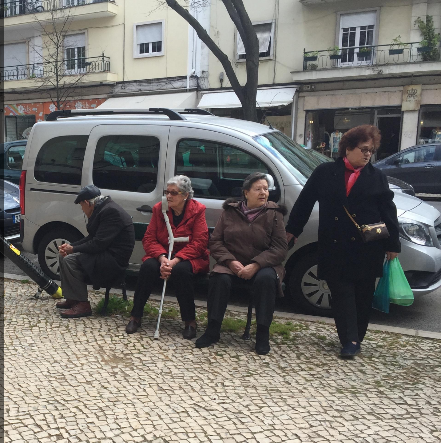
Desafio! GLUTTON aspirador urbano elétrico JF Alvalade, Lisboa 2013/2017